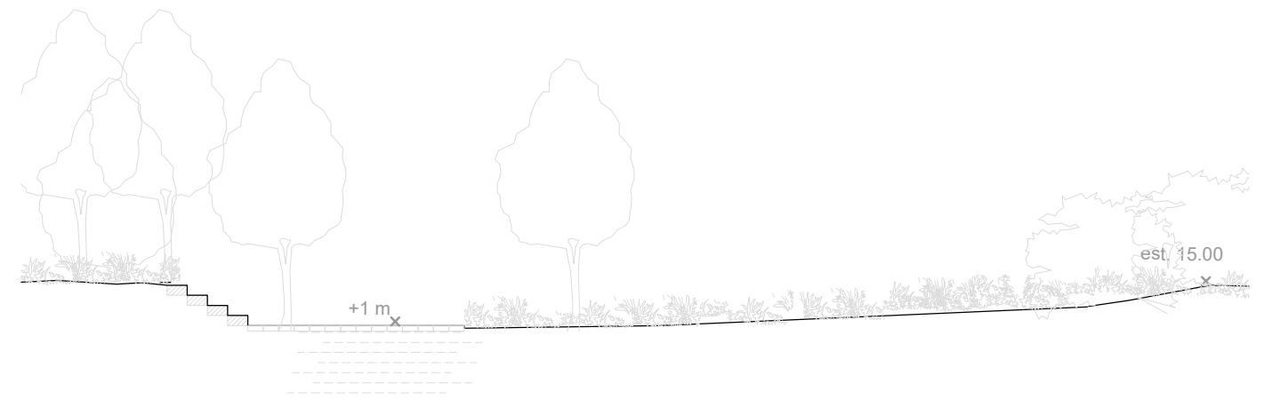
PRINCIPSNIT B 1:100